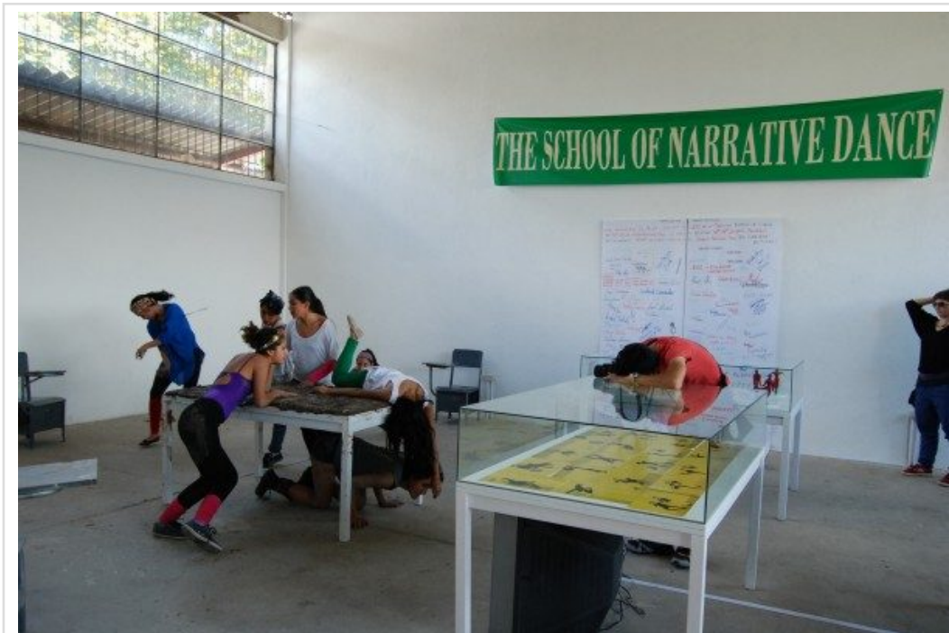
Registro del performance The School of Narrative Dance (Cuenca, 2014), de Marinella Senatore.