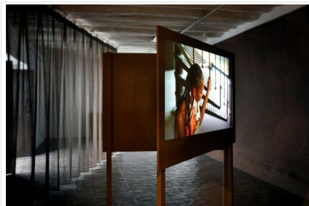
La Javanaise (2012), de Wendelein Van Oldenborgh. Cortesía de la artista