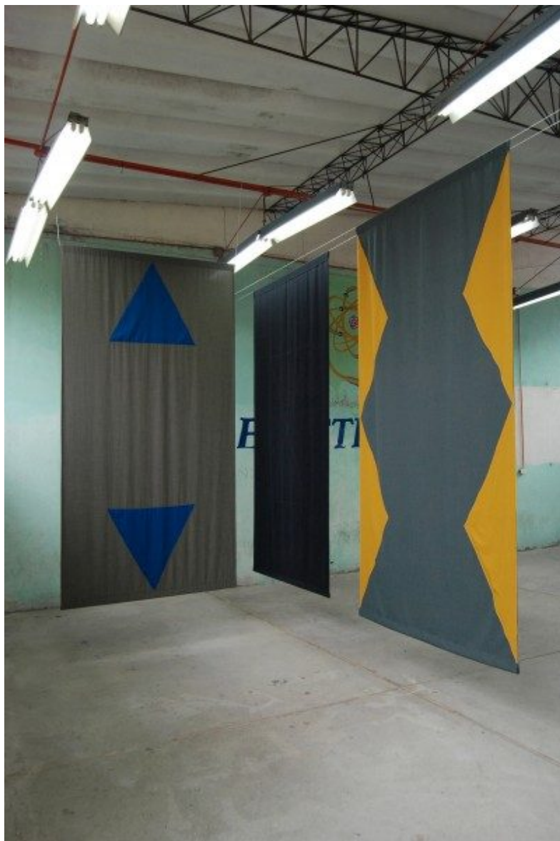
Vista de instalación Sin título (para Cuenca) (2014), de Felipe Mujica.