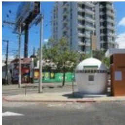
LA HISTORIA DE NuMu Y PROYECTOS ULTRAVIOLETA, CONTADA POR