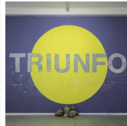
ALTA PARTICIPACIÓN CHILENA EN LA FERIA ARTLIMA 2018